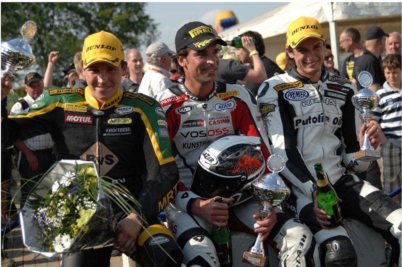
De hoogste trede is natuurlijk het ultieme doel!!

Doelen veilig stellen en plannen voor de toekomst, daar draait het in dit geval om. Op deze manier is team Art of Racing altijd verzekerd van een daadkrachtige samenstelling. Mocht er iemand wegvallen, dan kan het team gewoon doordraaien en kunnen we ons beoogde doel blijven nastreven.