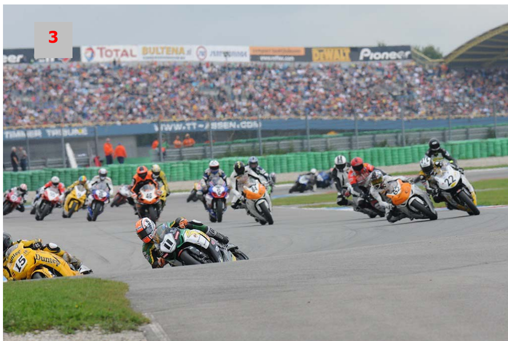
Foto 3: Volle tribunes tijdens één van de Dutch Superbike wedstrijden